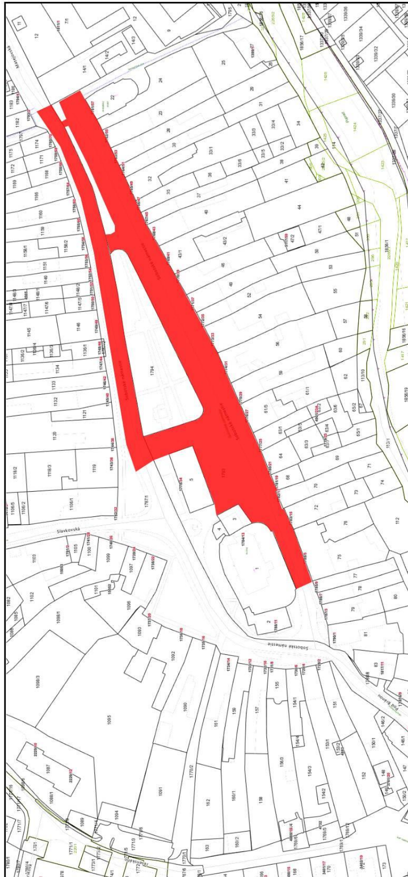
Príležitostný trh – Vianočný jarmok